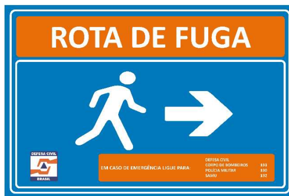
Figura 5 - Modelo de Placa de Rota de Fuga (Seta para a Direita).

O projeto inicial previa a instalação de placas de rota de fuga a cada 50 metros e sempre que houvesse mudança de direção, conforme orientação estabelecida na IT 001/2021.