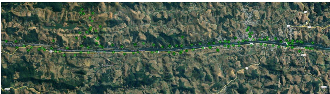
Figura 9b. -Pontos de medição do comissionamento Sonoro, trecho jusante.