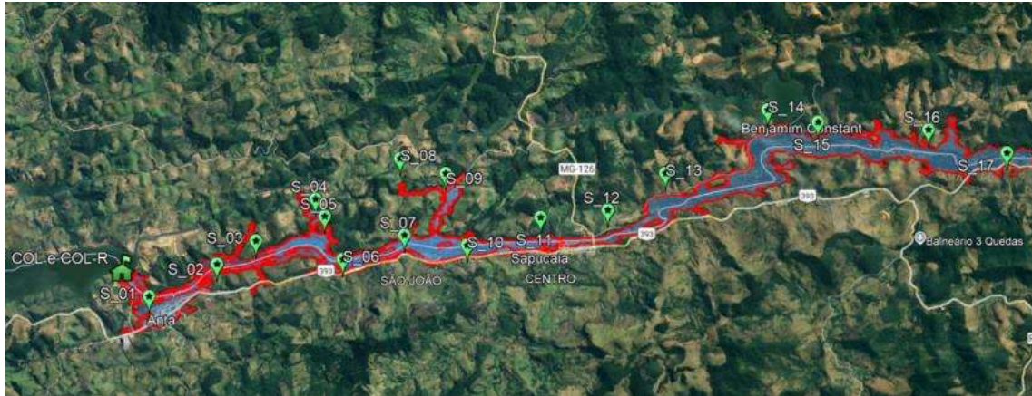
Figura 2a – Localização das ERs da ZAS, trecho montante