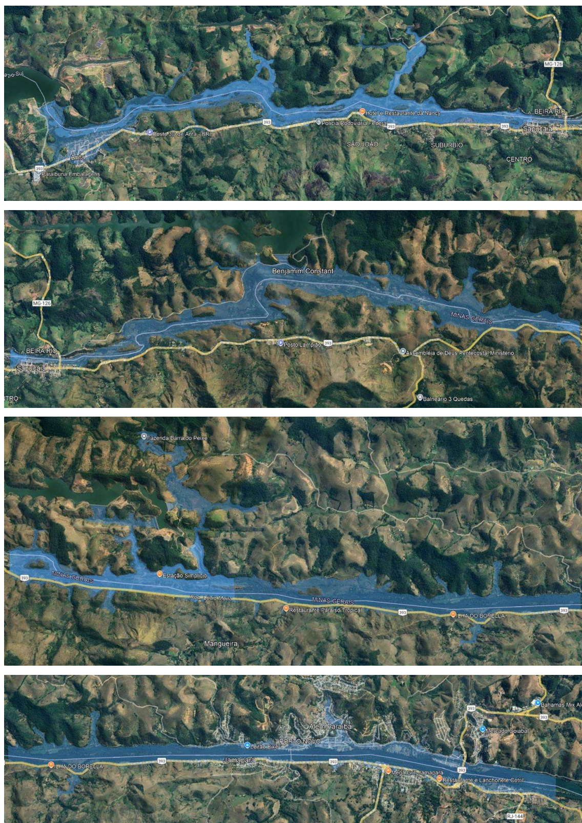
Figura 1 - Área de cobertura das sirenes, que engloba a ZAS e mais as áreas urbanas de Sapucaia/RJ, Carmo/RJ e Além Paraíba/MG.