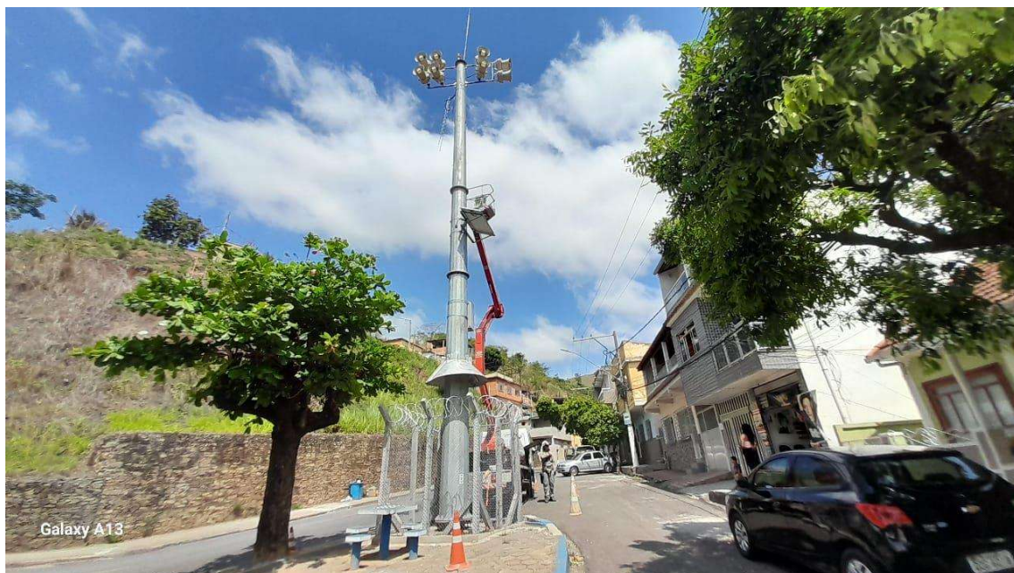
Figura 7. Estação Remota implantada