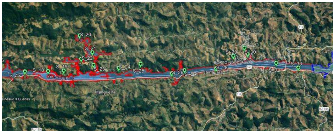
Figura 2b – Localização das ERs da ZAS, trecho jusante.

A ZAS encontra-se delimitada com uma linha vermelha e a ZSS está delimitada com uma linha azul.