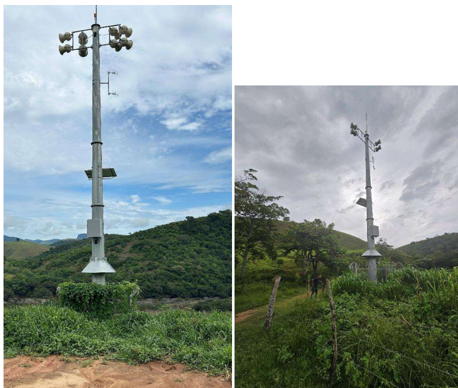
Figura 6 – Estações Remotas implantadas.

As figuras a seguir ilustram estruturas do sistema de comunicação e alerta da usina, implantadas na região.