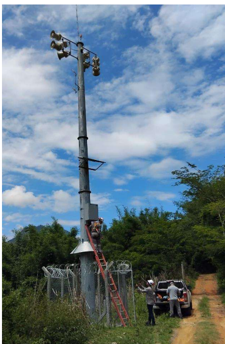
Figura 8. Manutenção de Estação Remotas implantada.