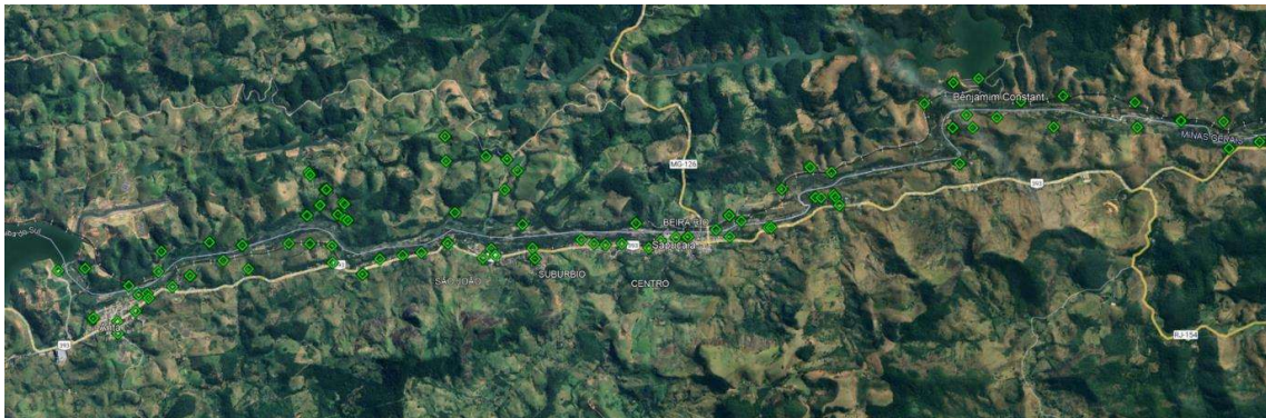
Figura 9a. Pontos de medição do comissionamento Sonoro, trecho montante.

A Figura 9 , a seguir, indica os locais de medição de pressão sonora.