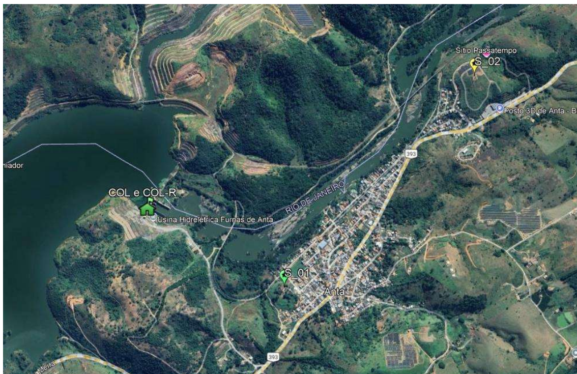
Figura 3 – Localização das ERs na ZAS, em Anta e da COL e COL-R.

Com base nestas locações das estruturas, foi feito um estudo acústico, em software específico para este propósito, visando mapear o nível de ruído na área de interesse e garantir, no mínimo, os 70 dB em toda a área de cobertura das sirenes.