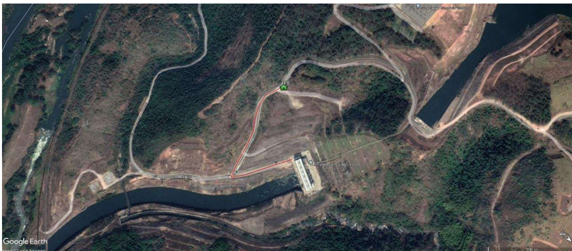
Figura 1 – PEs e RF da UHE Simplício.

As Figuras 1 e 2 a seguir, apresenta os pontos de encontro e rotas de fuga deste empreendimento, que se encontram também, em KMZ, no Anexo 15.1 deste relatório.