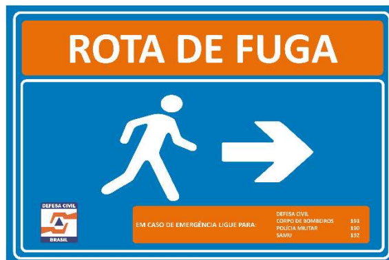
Figura 5 - Modelo de Placa de Rota de Fuga (Seta para a Direita).

O projeto inicial previa a instalação de placas de rota de fuga a cada 50 metros e sempre que houvesse mudança de direção, conforme orientação estabelecida na IT 001/2021.