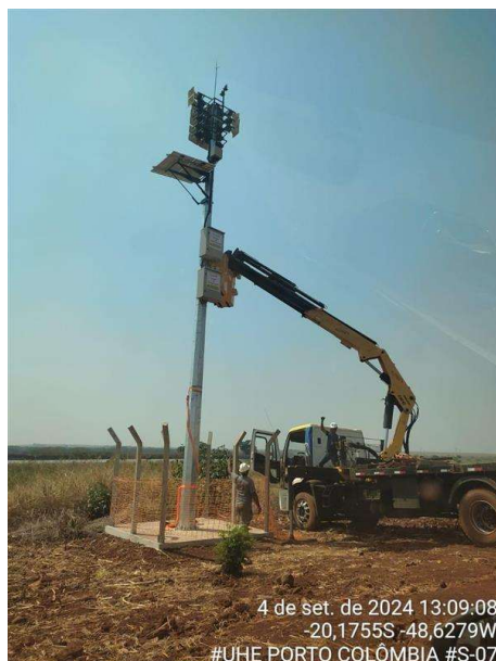
Figura 5 – Manutenção de Estação Remota implantada.