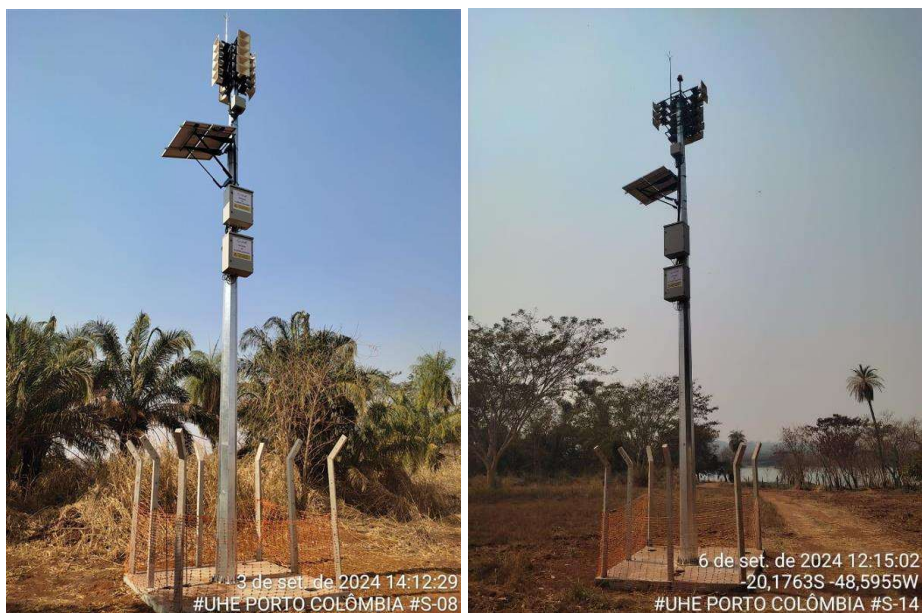
Figura 3 – Estações Remotas implantadas.

As figuras a seguir ilustram estruturas do sistema de comunicação e alerta da usina, implantadas na região.