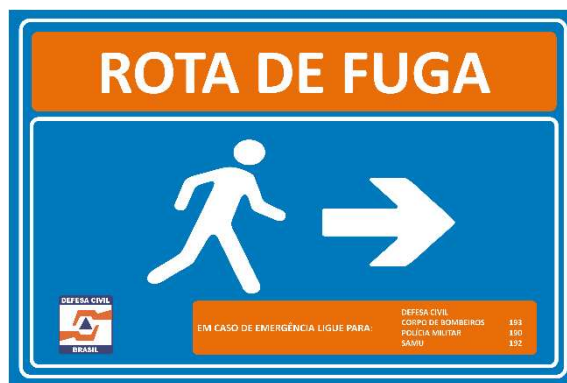
Figura 5 - Modelo de Placa de Rota de Fuga (Seta para a Direita).

O projeto inicial previa a instalação de placas de rota de fuga a cada 50 metros e sempre que houvesse mudança de direção, conforme orientação estabelecida na IT 001/2021.