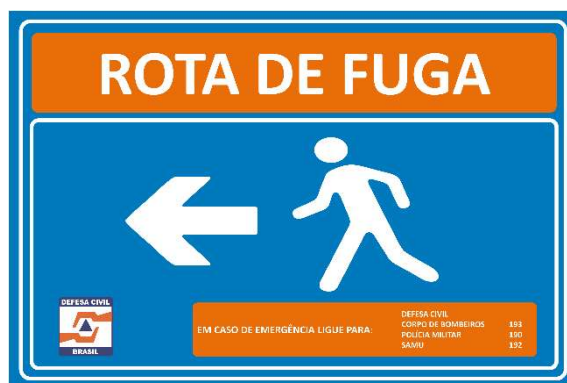
Figura 4 - Modelo de Placa de Rota de Fuga (Seta para a Esquerda).

A sinalização das rotas de fuga visa auxiliar na etapa de deslocamento aos pontos de encontro, buscando uma maior eficiência no processo de evacuação. As rotas de fuga devem ser sinalizadas por meio de placas indicativas, que direcionam para o ponto de encontro mais próximo, conforme modelos apresentados pelas Figuras a seguir.