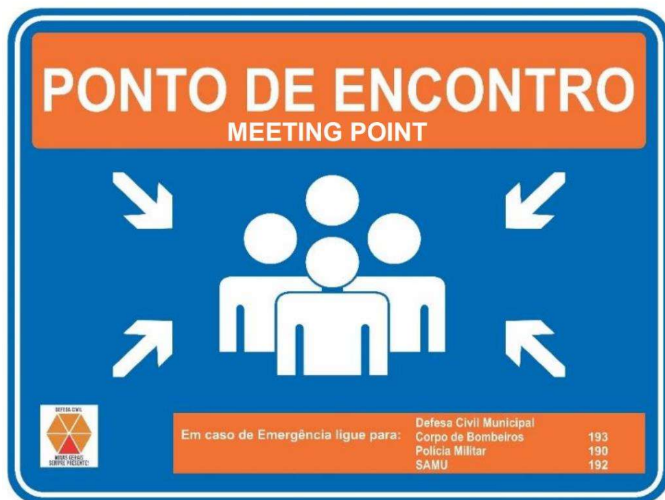
Figura 3 – Modelo de Placa de Ponto de Encontro.

Os pontos de encontro devem ser sinalizados com placas orientativas, dotadas de telefones úteis, em consonância com a IT 01/2021 da CEDEC-GMG, conforme modelo indicado na Figura a seguir.