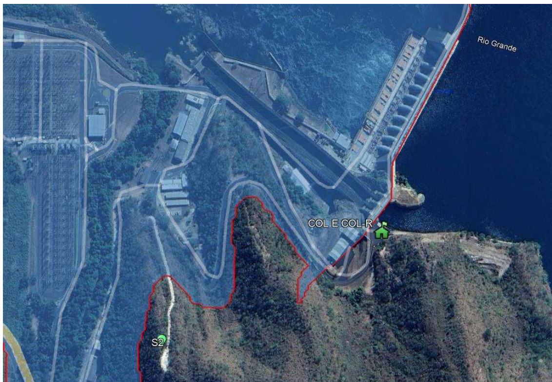
Figura 3 – Localização das ERs na ZAS e da COL e COL-R.

Os pontos em verde são as Estações Remotas implantadas.