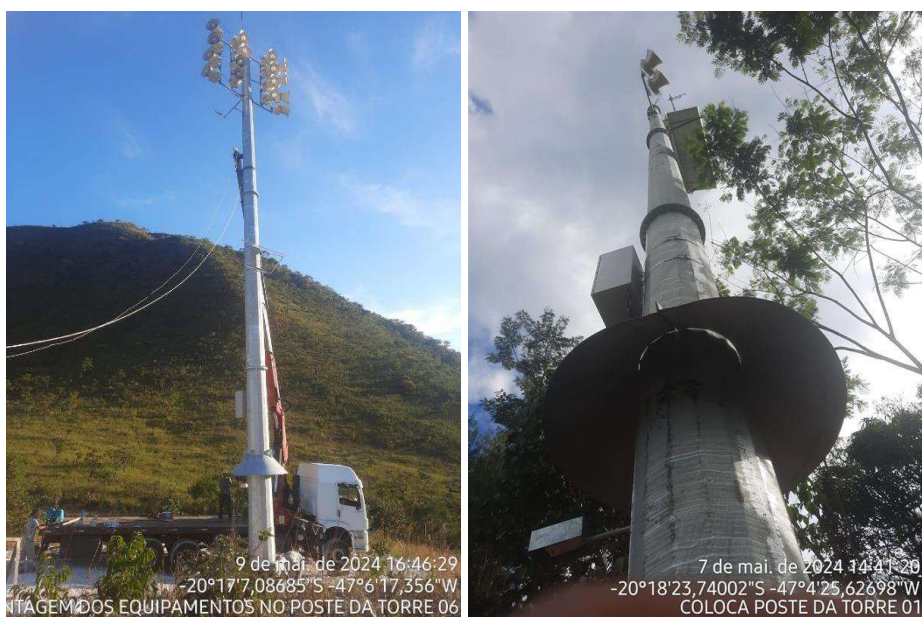
Figura 6 – Estações Remotas sendo implantadas.