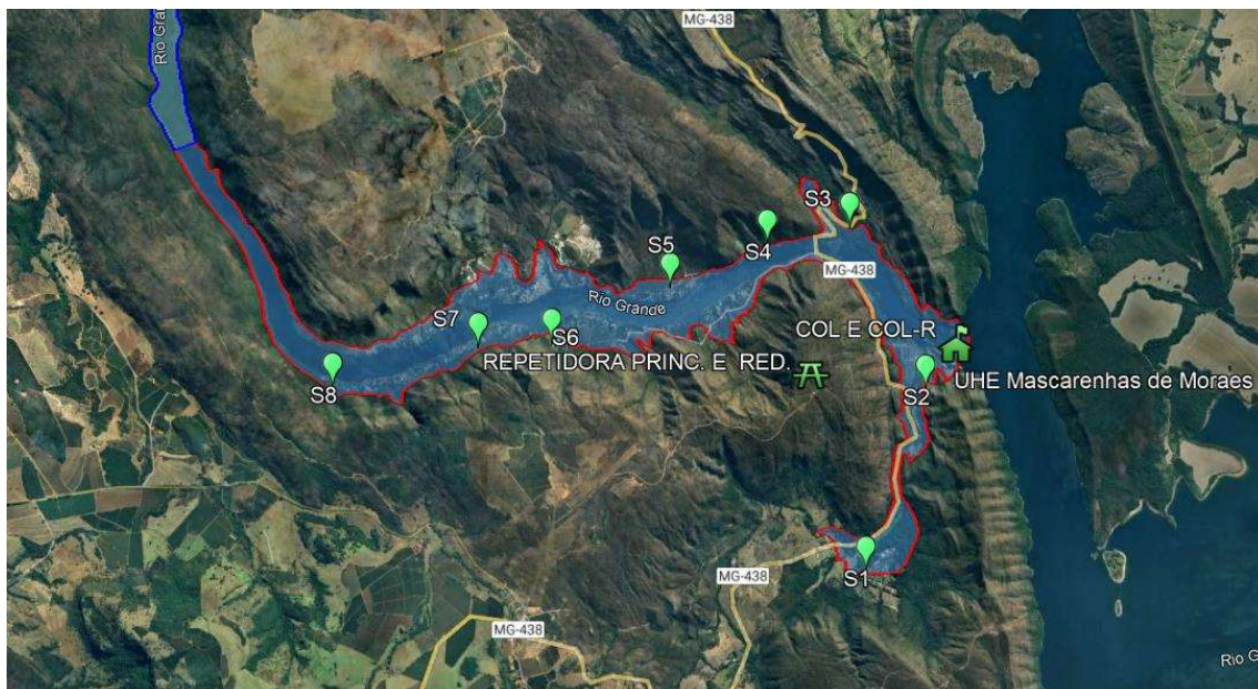
Figura 2 – Locação da COL e COL-R e das ERs da ZAS

A ZAS encontra-se delimitada com uma linha vermelha e a ZSS está delimitada com uma linha azul.