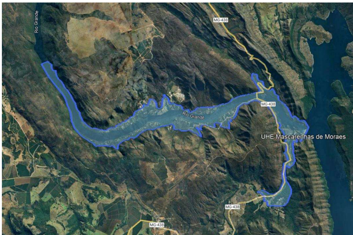
Figura 1 - Área de cobertura das sirenes, que engloba a ZAS