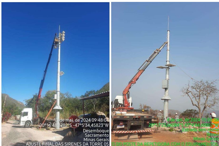
Figura 5 – Estações Remotas sendo implantadas.